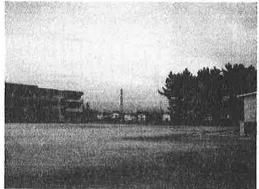
《設置場所は校庭東側です》

この問題につきまして、2010年6月議会で一般質問したところ、9月補正予算で仮設校舎の借上料が追加計上されました。教育の一定水準を平等に確保するため、施設整備に取り組みました。